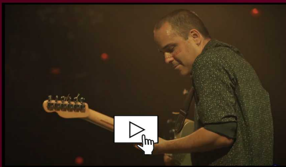
_Teaser de promo Gira Los O mil km _