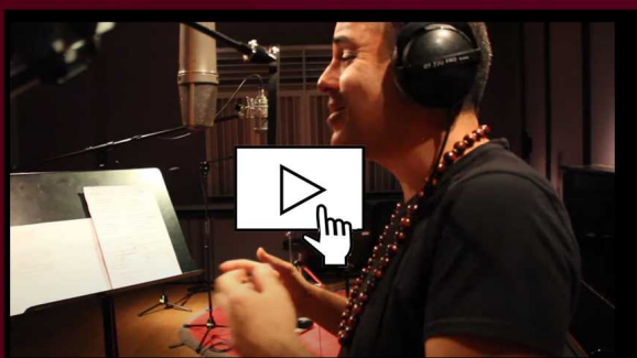
_Making of Nou disc._