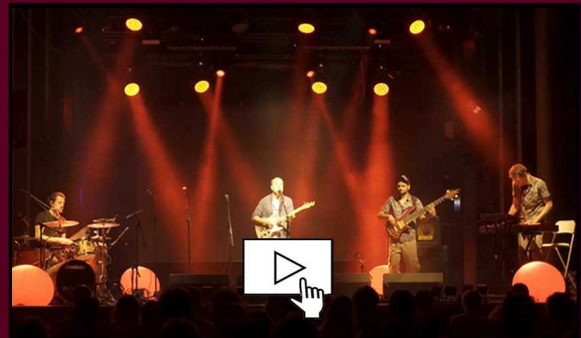
_Live a Apolo Presentació disc._