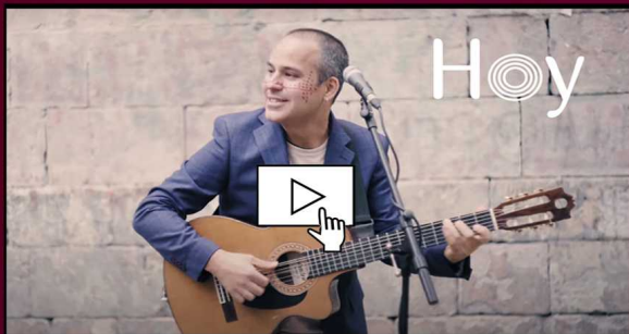
_Videoclip "Hoy" _