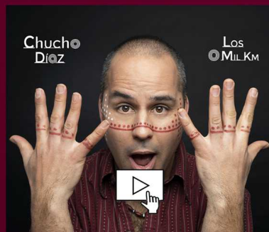
_Escolta _Los O mil km_ Nou disc._