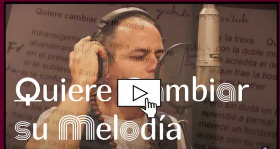
_Videoclip "Quiere cambiar su melodía" _