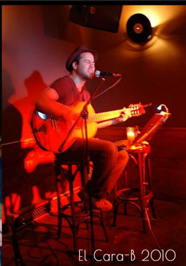
El Cara-B 2010

Arran de la presentació d'aquest treball a la sala Apolo de Barcelona en 2005 arrenca un període d'intensa activitat amb directes a sales catalanes (Sidecar, Casa Elizalde, Harlem Jazz Club, Salamandra, Sala Zac-Club) i de Madrid (Búho Real, Rincón del arte nuevo, Bandush 101..).