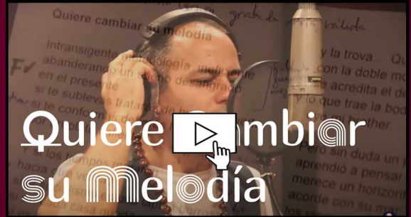
_Videoclip "Quiere cambiar su melodía" _