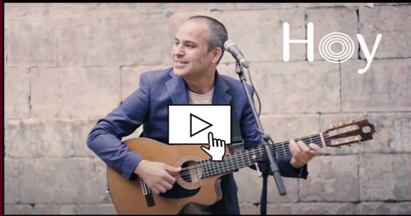
_Videoclip "Hoy" _