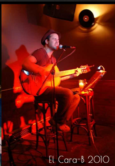
El Cara-B 2010

A raíz de la presentación de este trabajo en la sala Apolo de Barcelona en 2005 arranca un periodo de intensa actividad con directos en salas catalanas (Sidecar, Casa Elizalde, Harlem Jazz Club, Salamandra Sala Zac-Club) y Madrid (Búho Real, Rincón del arte nuevo, Bandush 101..)