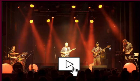
_Live en Apolo Presentación disco_