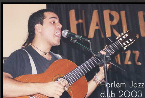
Harlem Jazz club 2003