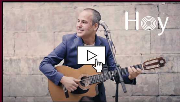
_Videoclip "Hoy" _