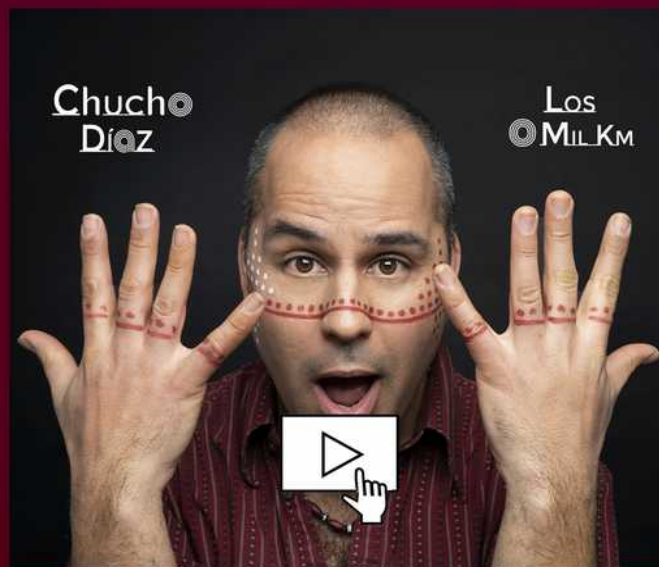
_Los 0 mil km_ Nou disc_